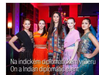
Na indickém diplomatickém večeru On a Indian diplomatic event

Být zdravý. Mít někoho, kdo vás miluje. Mít někoho, koho můžete milovat. Mít práci, která vás baví a naplňuje... Jsou to klišé? Možná ano, ale na nic lepšího jsem zatím nepřišla. Možná ještě jedna věc – věřím v uvědomění. Věřím, že když budeme víc vědět a víc chápat, budeme šťastnější. ●